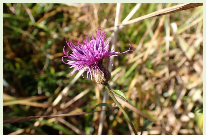
↑ 10月15日 タムラソウ 花期ももうすぐ終わりですが、元気に咲いています。