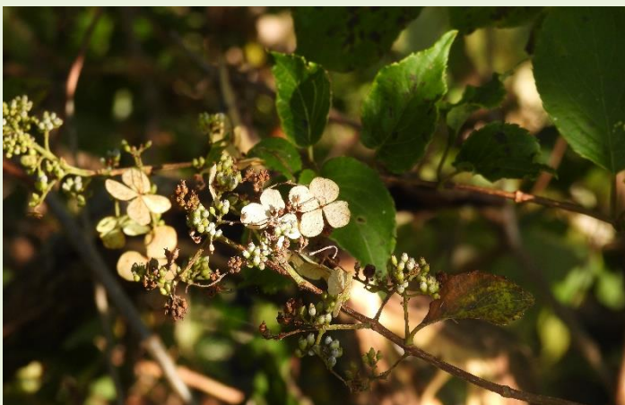
↑ 10月15日 ノリウツギ 花期が終わり、ドライフラワーへと変身しました。