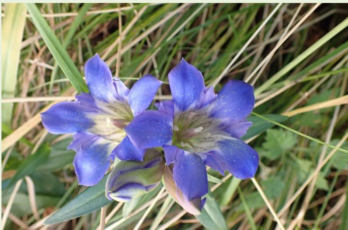
↑ 10月15日 リンドウ 朝は蕾の状態ですが、陽の光を浴びて花が開きます。