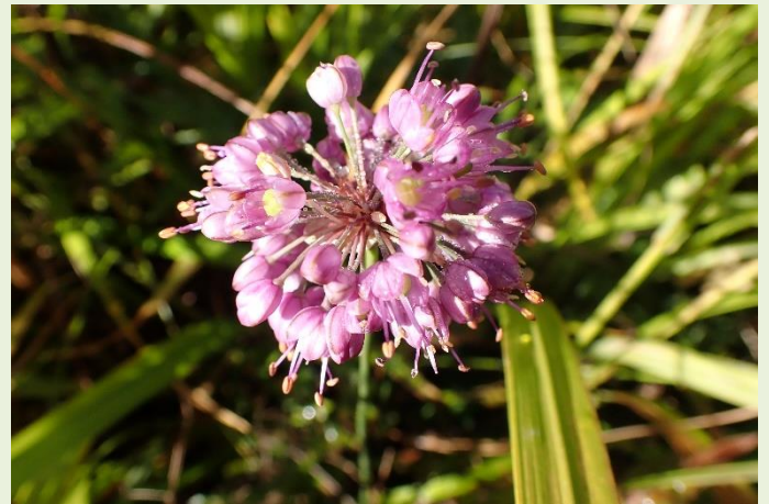
↑ 10月15日 ヤマラッキョウ 花盛りを迎えています。とてもきれいな色です。