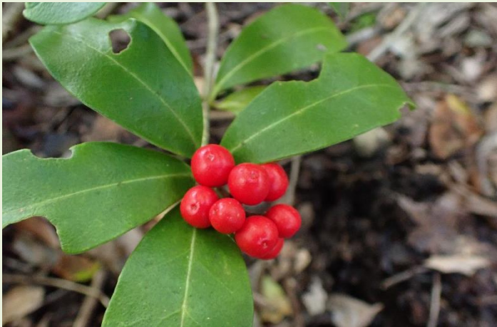
↑ 10月15日 ツルシキミ 森の散策路できれいな赤い実をつけています。