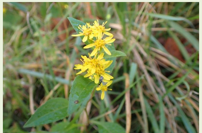
↑ 10月15日 アキノキリンソウ いろんな場所でよく見かけます。キク科の花です。