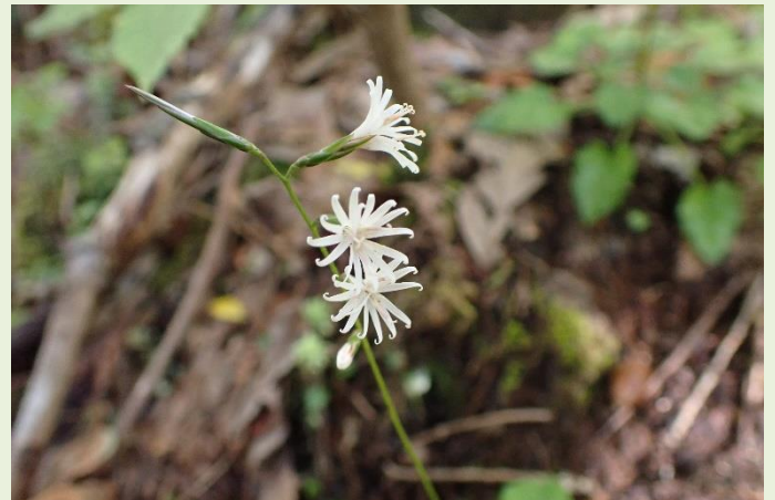
↑ 10月15日 キッコウハグマ 白くて小さい可憐な花を咲かせます。