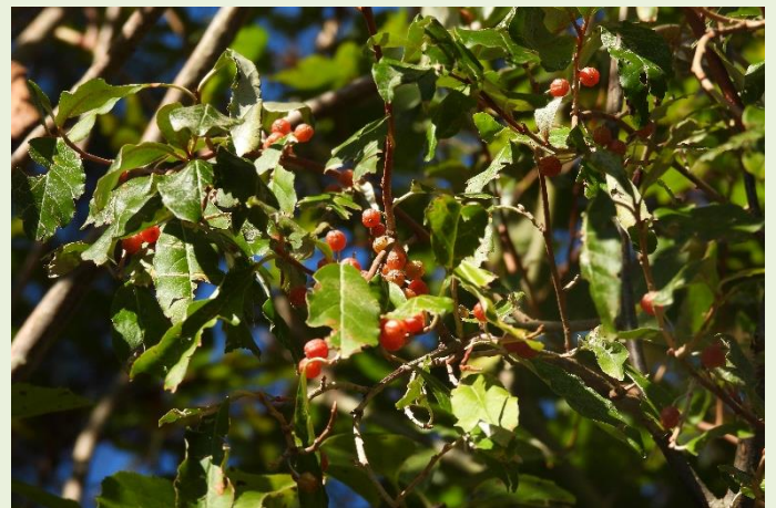
↑ 10月15日 アキグミ 秋に実をつけるグミで、鳥たちがよく食べます。