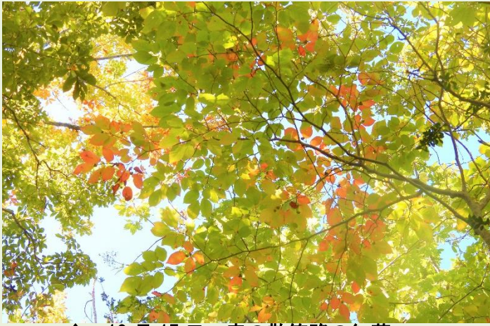
↑ 10月15日 森の散策路の紅葉 シラキが少しずつ赤く色づいてきていました。