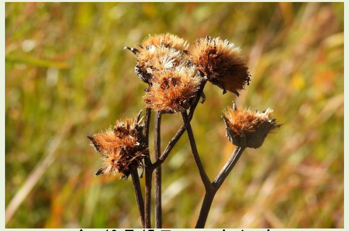
↑ 10月15日 ハンカイソウ かたい実の中にはふわふわ種が入っています。