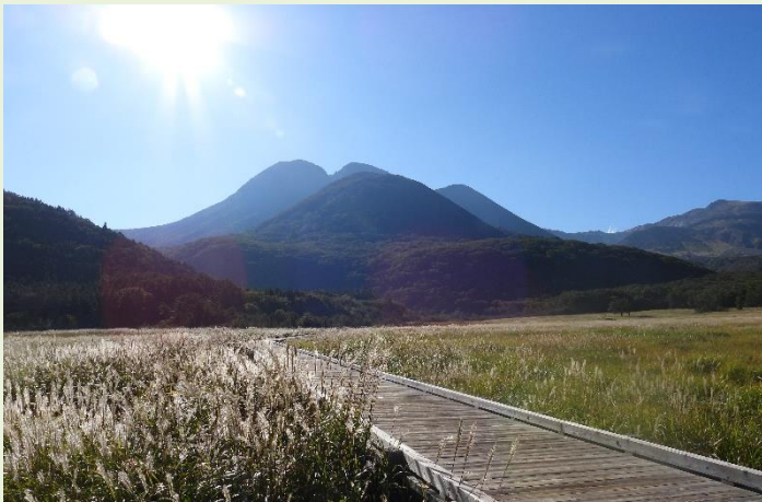
↑ 10月15日 ススキと三俣山 とてもいい天気です！硫黄山の煙もよく見えました。

今年のタデ原自然情報はこれにて終了となります。秋が深まり冬となり、野焼きを終えるとタデ原に再び春がやってきます。四季折々の季節にタデ原を訪れ、沢山の自然に触れ合ってみてくださいね。