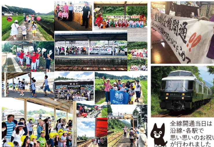
全線開通当日は沿線・各駅で思い思いのお祝いが行われました

豊後大野市にとって、大事な交通手段「豊肥本線」。 「平成 28 年熊本地震」により不通となっていた豊肥本線が 令和2年8月8日(土)、4年4ヶ月ぶりに全線復旧・開通しました!!