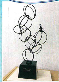
最高得点者に贈られる 特製竹トロフィー「湯けむり」 (竹田市在住の竹藪家・中臣一氏製作)