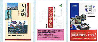
「まるごとわかる大分県」「大分学事始」第1集(明石書店刊) 「平成と大分」(大分合同新聞社刊)

一般問題100問のうち、80問は下記参考書3冊の内容から出題します。この3冊をしっかりマスターすれば、高得点も期待できます。ぜひ事前準備をしてチャレンジしてください。