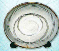
「しんけん大分学検定」特製 小鹿田焼 郷土料理本