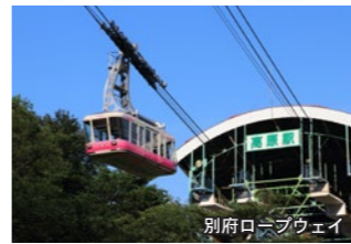
別府ロープウェイ