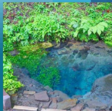
※写真は男池のイメージです