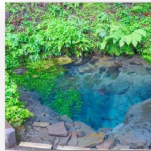
※写真は男池のイメージです

黒岳の麓にある男池(おいけ)は阿蘇野川の源流にあたり、黒岳が長い時間をかけてろ過した水が湧き出している湧水群です。環境省の「日本名水百選」、「豊の国名水15選」にも認定されており、湧出量は平均毎分14t、1日に約2万tと水量が豊富で、休日には水を汲みに集まる人々で賑わいます。底が見えるほどに透き通った水は、口に含むとまろやかで優しい口あたりで、水質は炭酸水素カルシウム型。古くから地域住民の生活用水、かんがい用水として利用され、「黒岳の自然を守る会」が保護と周辺の保全に力を入れています。湧水が流れる先へしばらく歩いていくと「名水の滝」が現れます。遊歩道なども整備されているため、心地良い木漏れ日のなか森林浴やトレッキングを楽しめます。