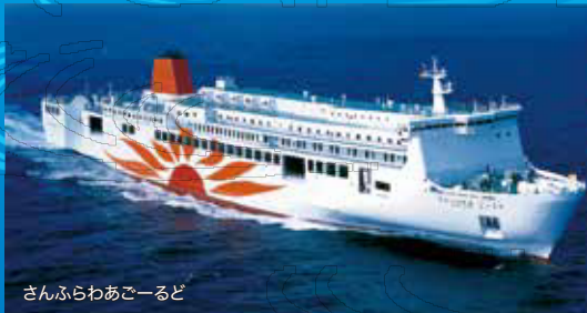
さんふらわあーとど