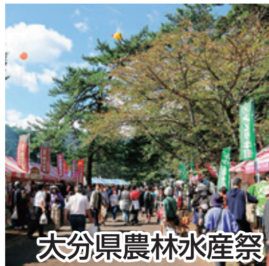
大分県農林水産祭