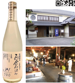
百合仕込み 特別純米