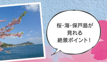
桜・海・保戸島が 見える 絶景ポイント!

高井島 愛宕神社 狩床 越智小学校 高浜の褶曲 高浜海水浴場 高浜 カブト岩 蔵谷 小仁宅 落ノ浦 津久見市 四浦出張所 落ノ浦天満宮 本教寺 落ノ浦権現