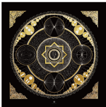
AGELOS 《Probable Selves and Life Choices》 2018