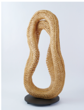
長谷川 剛 《Looks Like You (Looks)》 2022 跳躍するつり手たち展 東京都京セラ美術館 展示作品