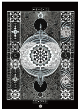
AGELOS 《Local Point of Incarnation》 2019

2024. 8/5 MON - 8/25 SUN 10:00-17:00 (金曜日は19時まで)