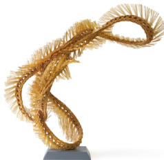
長谷川剛 《Devour》 2021