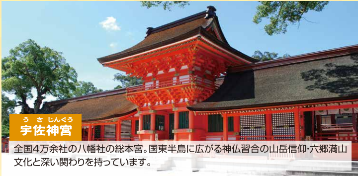
うさじんぐう 宇佐神宮

別府または由布院=宇佐神宮=富貴寺=大分空港(昼食)=両子寺=文殊仙寺=由布院または別府 ※昼食はついておりません。