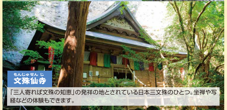
もんじゅせんじ 文殊仙寺

国東半島の中心にある六郷満山寺院で、開基は養老2年(AD718)仁聞菩薩によるもの。山門に安置されている仁王像は国東最大のものであります。