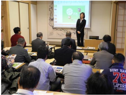
咸宜園教育センターでの大分県 PR