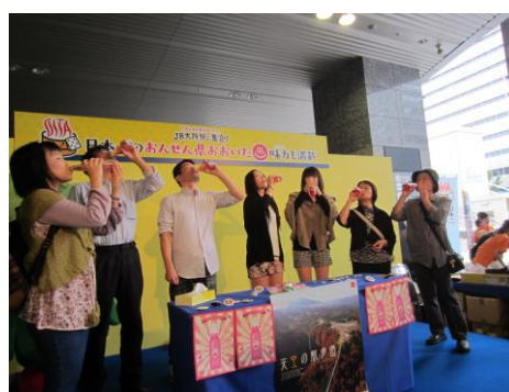
市町村ステージイベント