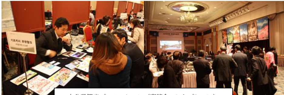
大分県観光プロモーション（商談会・レセプション）

また、2月19日、20日には、釜山市において本県の観光資源の魅力を官民一体となって売り込むため、大分県観光プロモーションを実施した。県内観光事業者等51名、現地の旅行関係者等から70名を超える方の参加をいただき、商談会、レセプションが開催され、会場では常に熱のこもった商談や情報交換が行われるなど、現地旅行関係者との関係強化が図られた。