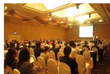
シンガポール商談会・説明会

九州観光推進機構や九州各県と連携して中国、シンガポール、香港などメディア取材や旅行エージェント等の招聘などにより、情報発信や商品造成を働きかけた他、