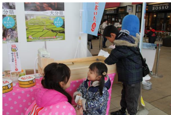
おんせん県おおいたフェア in 千葉 三井アウトレットパーク木更津 (千葉県木更津市) (平成 26 年 2 月 15 日実施)