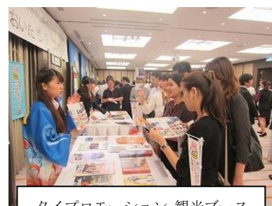
タイプロモーション 観光ブース

また、観光・県産品の一体的なプロモーションを目的として大分県が主催した「大分県タイプロモーション」に参加し、観光PRを行った。