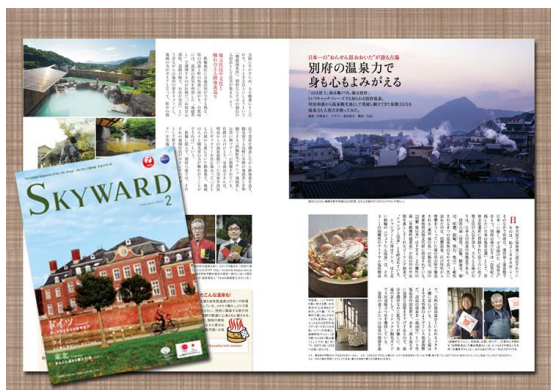
JAL 機内誌 SKYWARD (平成 26 年 2 月号大分県 PR 記事)

航空各社や就航先地域等と連携を図りながら、「おんせん県おおいた」の魅力・情報発信を行い、観光客の誘致を進めることにより、大分空港の利用促進を図ること目的として、JAL 機内誌への PR 記事の掲載や、関東圏域を対象とした観光情報の発信を行った。