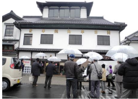
豆田町視察の様子

3月15日(土)～16日(日)に JTB 関西地区の教育旅行担当者 19 名を対象とした招聘ツアーを実施。