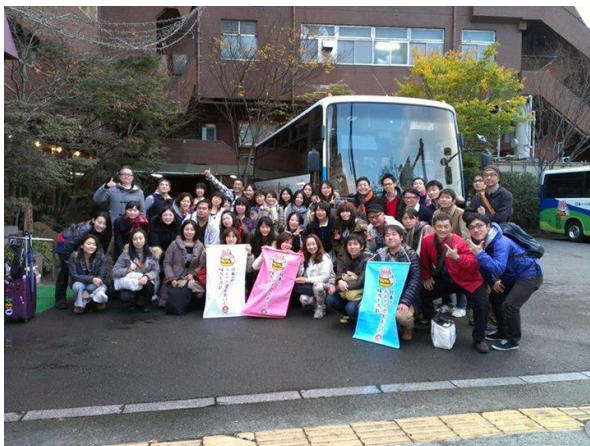
大分県フィールドワーク (平成25年11月30日～12月1日)

全8コマの講座は、大分県での1泊2日のフィールドワークも含まれており、講座の最後は、フィールドワークでの体験を踏まえ4コースのモデルプランの提案があった。