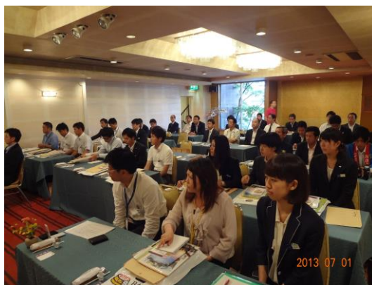
日本旅行現地研修の様子

住吉浜リゾートパークに宿泊し、くにもみグリーンツーリズム体験、APUプログラム体験、杵築の城下町散策などを行った。少人数での現地研修となったため、意見交換会の時間を長めに設け、大分県側より各10分ずつのPRのあとディスカッション形式での意見交換会を行った。