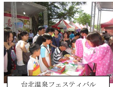
台北温泉フェスティバル

また、台湾における誘客活動に先行して取り組んでいる熊本県と連携し、「日本の観光・物産博」への出展やセールス活動等を実施した。